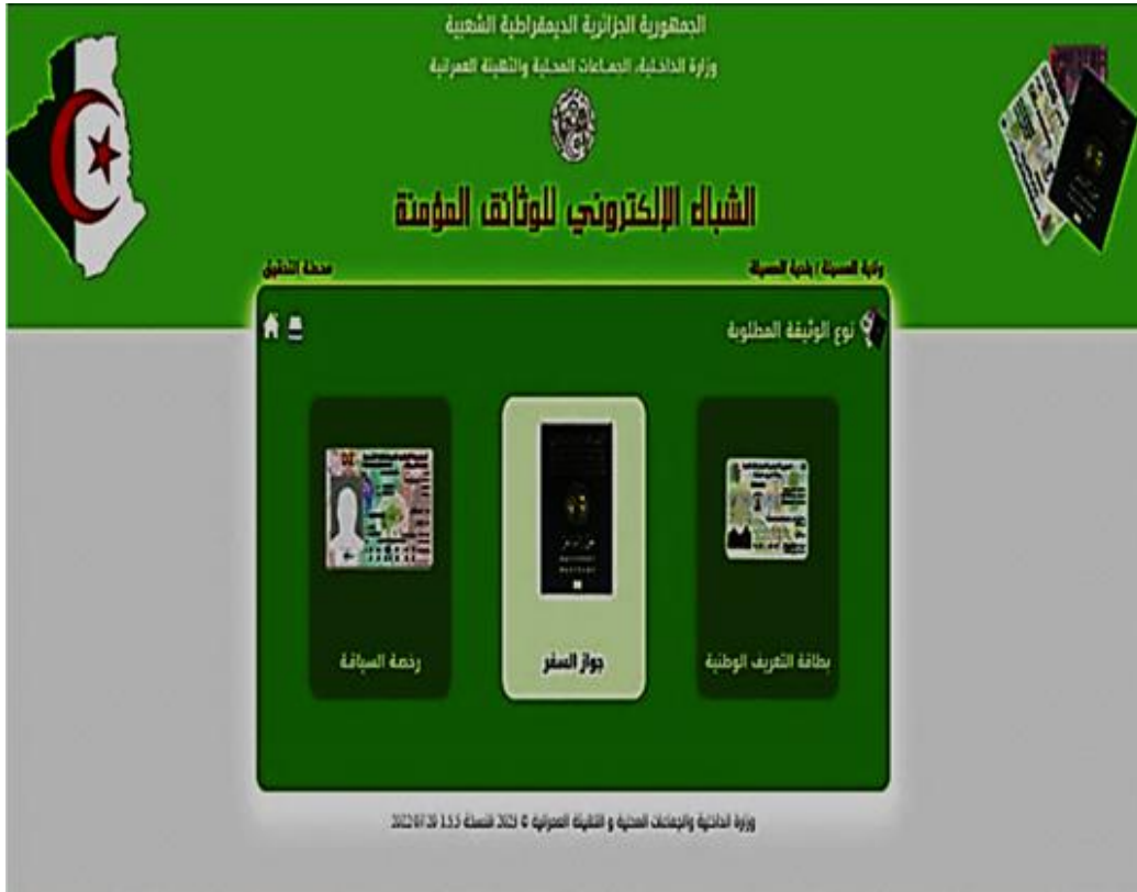
الشكل 1: (صورة لواجهة البرنامج في محطة التدقيق)