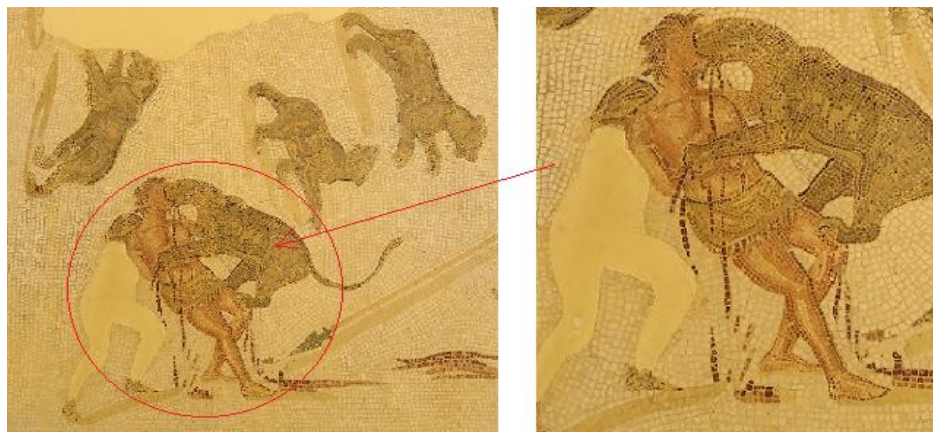
A: tableau complet

Ces édifices symbolisaient le pouvoir romain et le contrôle social à travers la violence et le divertissement.